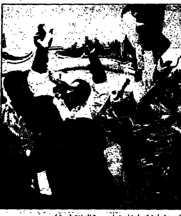
الشرطة الفلسطينية مع متظاهرين في اجازة حاجز اريحا على طريق غزة

■ القدس - في بيان صادر عن وزارة الدفاع الاسرائيلية، أعلنت ان ننتياهو يقول ان الفلسطينيين لا يكافحون الارهاب بما فيه الكفاية. وقالت الوزارة ان هذا البرنامج يهدف الى توفير التعليم لاولاد الفقراء. وقالت الوزارة ان هذا البرنامج يهدف الى توفير التعليم لاولاد الفقراء.